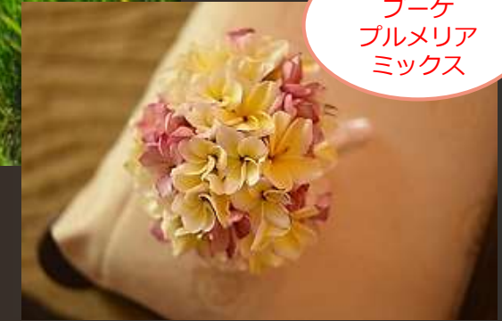
基本生花 ブーケ プルメリア ミックス