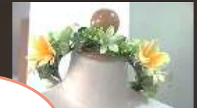
花冠 アップ グレード 3,000円